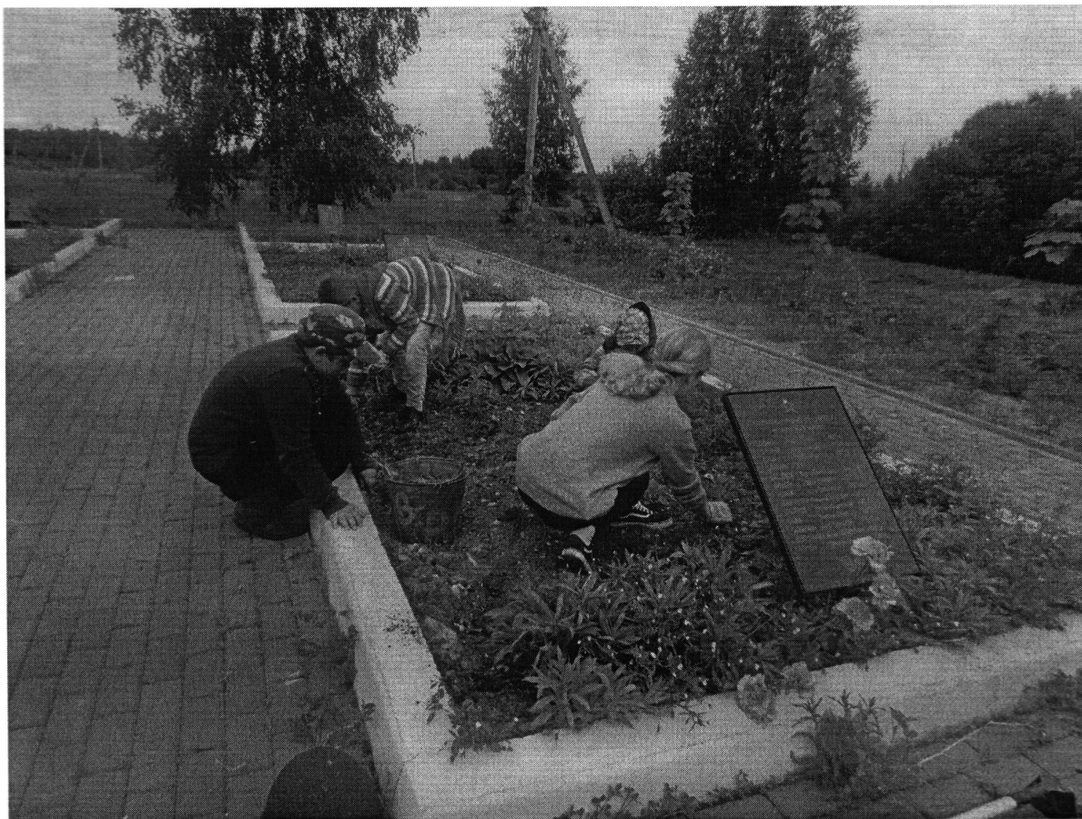
Уход за Полем Памяти