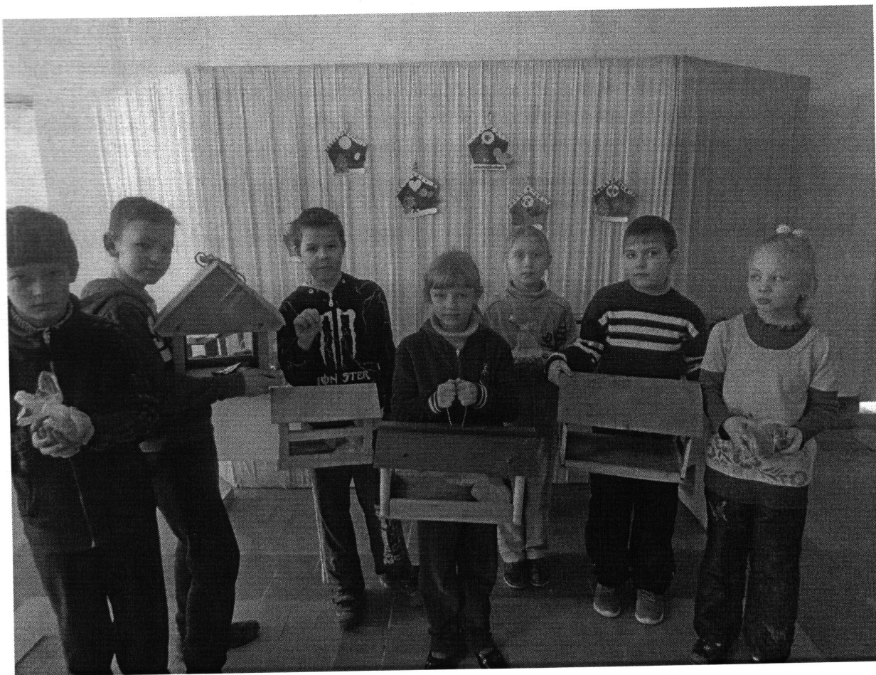
Участие в Акции «покорми птиц зимой»

праздников, которые постепенно входят в дома наших учеников. Родители активно вовлечены в совместную деятельность с детьми, проведены мероприятия с участием семей: детские православные утренники, благоустройство общественных мест, акция «Цветы Победы», поездки на районные спортивные мероприятия, акция «Милосердия», соревнования по шахматам и шашкам с участием людей разных поколений. ДТОО «Родные просторы» совместно с ДК Соловьёвского поселения организовали досуговую деятельность в каникулярное время для детей и провели десять занятий по настольному теннису, соревнования по шахматам. В совместной работе с администрацией Соловьёвского сельского поселения проведены мероприятия по настольному теннису, волейболу. Вместе с приходом храма иконы Божией Матери «Взыскание Погибших» посажены цветы на территории храма, проведена акция по раздаче одежды и игрушек нуждающимся семьям, оказана помощь по украшению храма к православным праздникам «Рождество Христово», «Пасха», «Троица». В течение учебного года помощь в награждении детей на мероприятиях оказывали ДК, Администрация поселения, приход Соловьёвского сельского поселения.