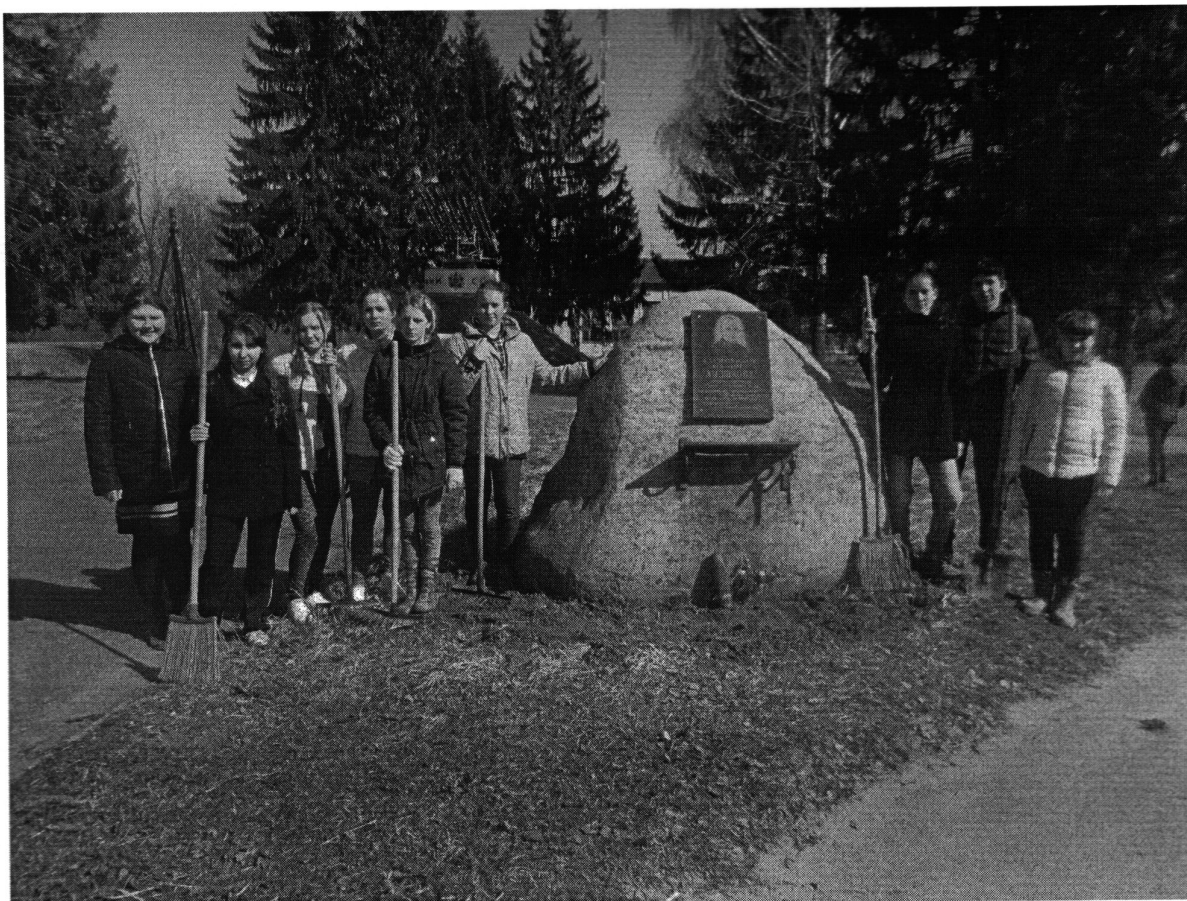
Благоустройство памятных мест

Патриотизм выступает в единстве духовности, гражданственности и социальной активности личности, осознающей свою неразрывность с Отечеством.