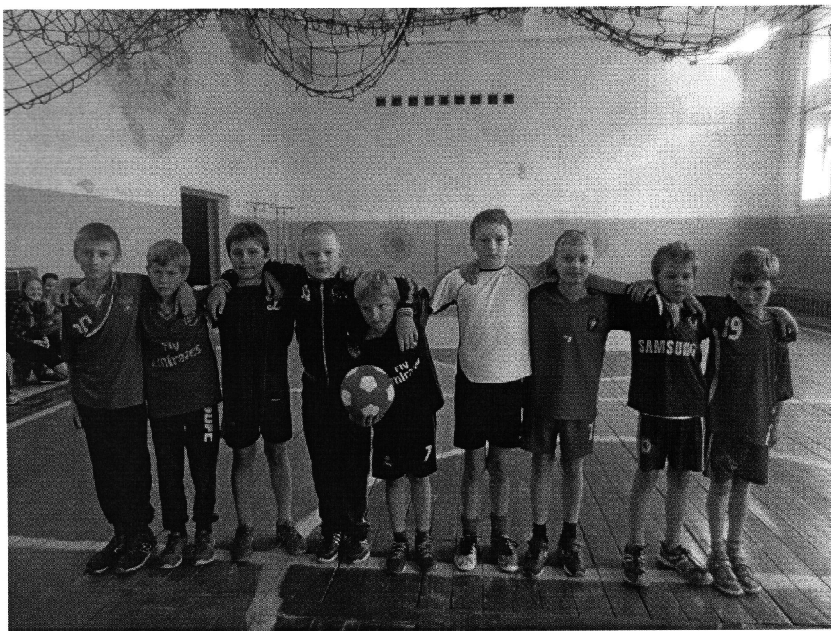
Спортивный праздник «День юного футболиста»

Краеведческая работа по изучению родного края основывается на разработке краеведческих маршрутов с исследовательской направленностью: «Судьба человека», «История моей деревни», «Экологическая тропа», «Краеведческий Атлас моей малой Родины». Последняя работа была представлена на школьной научно-практической конференции.