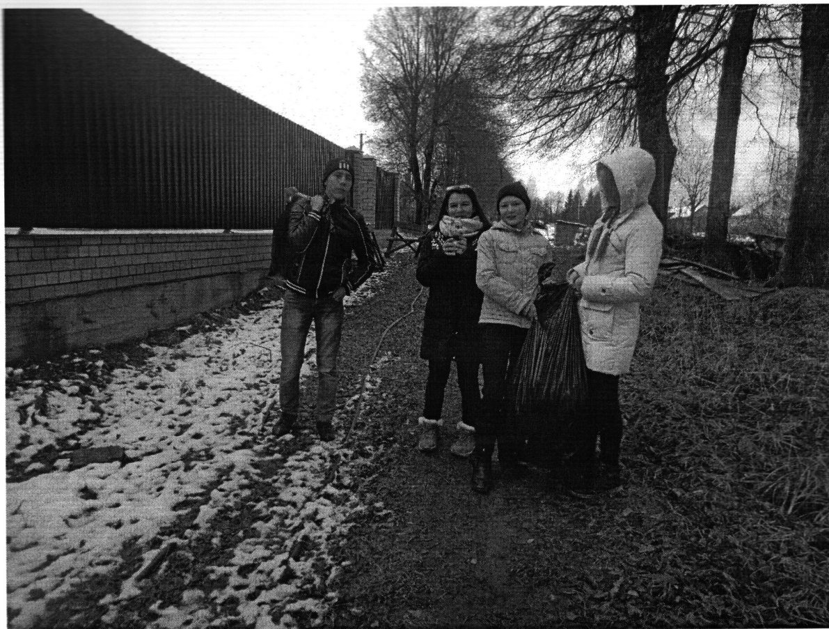
Экологическая Акция по уборке территории дер. Соловьево