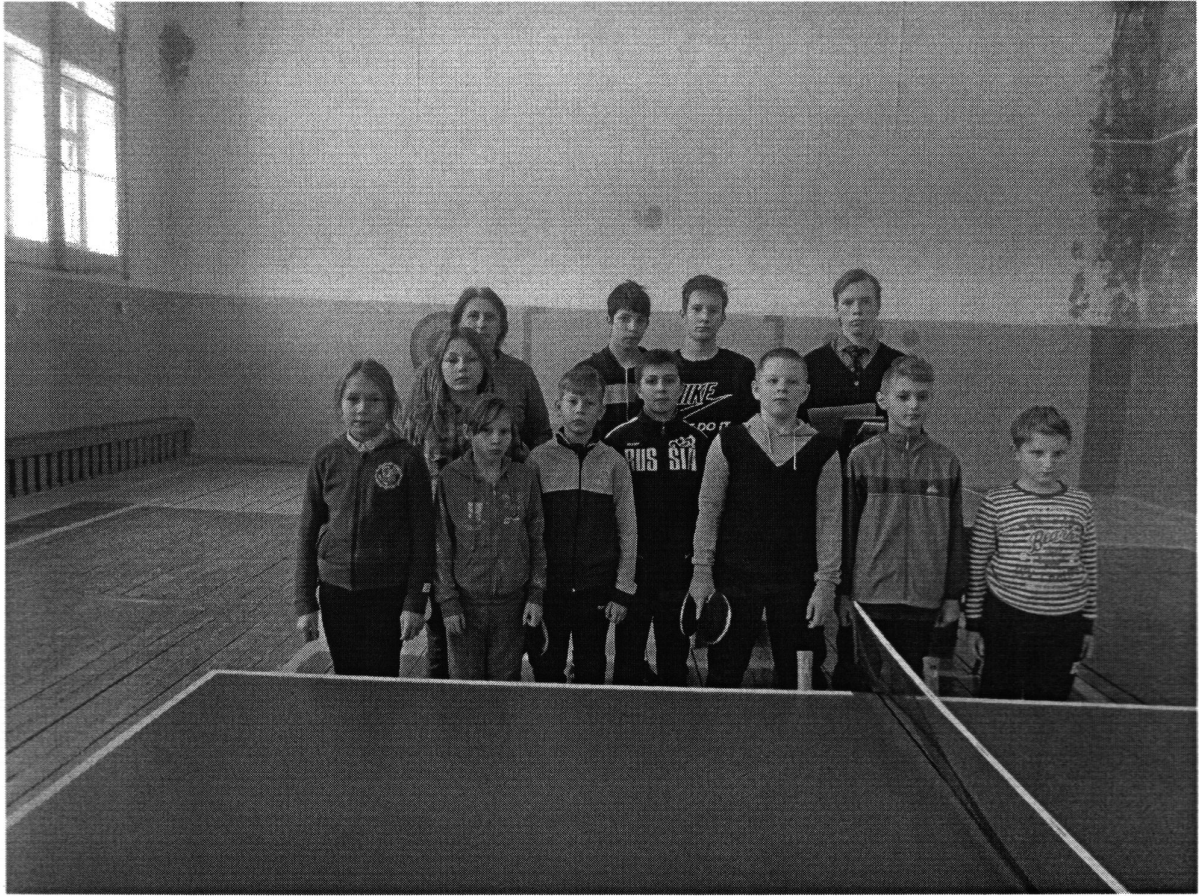
Соревнования по настольному теннису